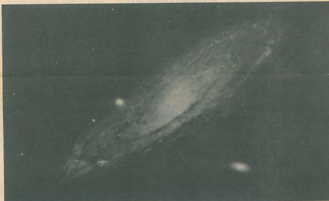
La galaxie d'Andromède, une "voisine" de notre voie lactée, située à deux millions d'années lumière de nous.

Si l'on accepte que la lumière voyage à 300, 000 kilomètres-seconde (soit 9.5 millions de km annuellement), il faut alors savoir que l'étoile la plus proche de la terre, Alpha Centauri A, se situe à un peu plus de quatre années lumière, tandis que notre deuxième "voisin", Étoile de Bernard est à 12 années lumière. Selon les observations enregistrées à ce jour, il a été